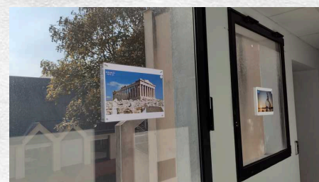
Le stand européen au CDI

Comme l'an passé, les élèves ont pu participer à un jeu organisé dans le bâtiment des langues : leur mission était de trouver quels monuments étaient représentés sur les photos réparties dans le bâtiment A. Ils devaient également trouver la ville où le monument se situait ainsi que le pays.